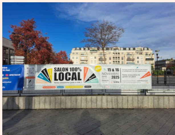
Banderole présente devant la Gare de Sartrouville

+ 2 000 Flyers distribués à Sartrouville et ses environs